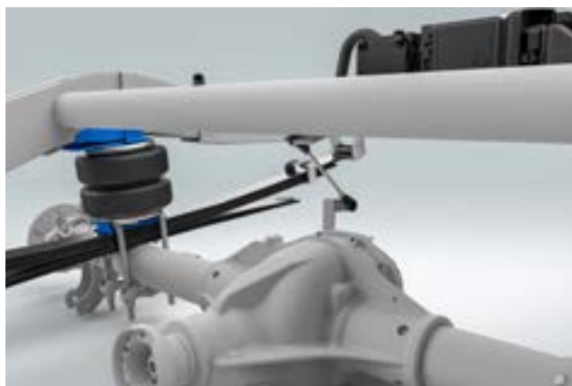
CONTENUTO DEL SET: VB-LEVELAIR

Il sistema VB-LevelAir è costituito da un sistema di base VB-SemiAir con controllo automatico dell'altezza.